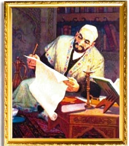
Kaşgarlı Mahmut tarafından yazıldı, 1072-1074